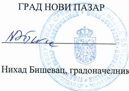
Нихад Бишевац, градоначелник